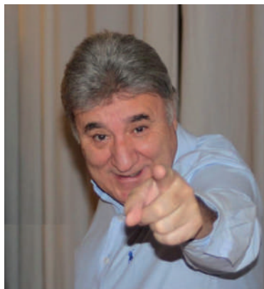
TONY ANTONIO EL HUMOR DE HOY AYER Y DE SIEMPRE